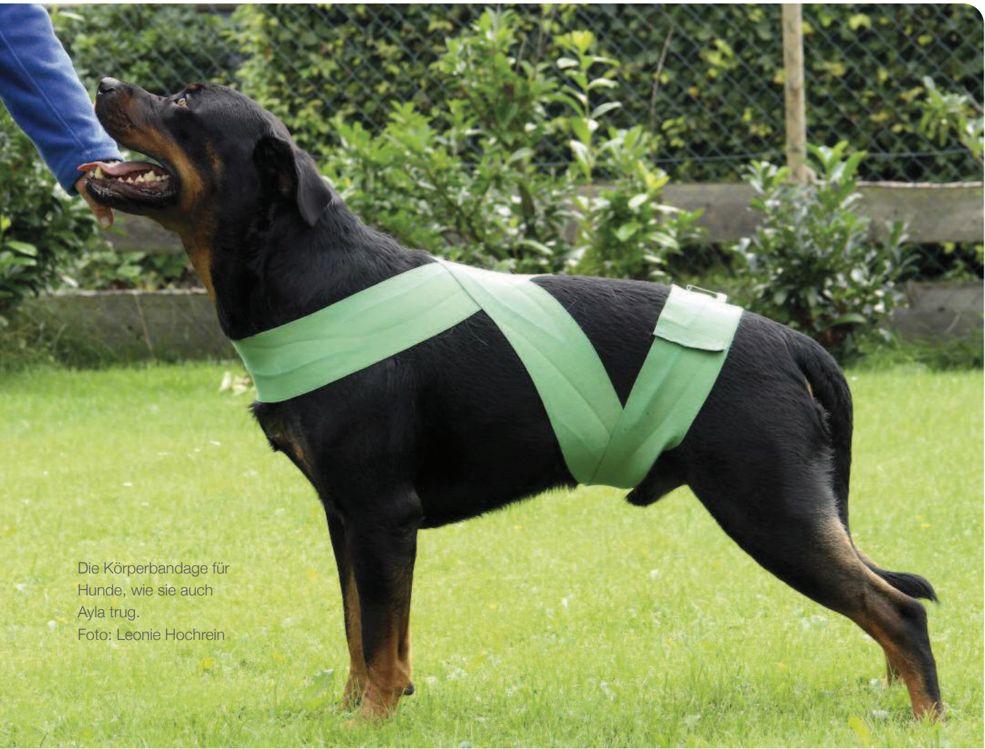
Die Körperbandage für Hunde, wie sie auch Ayla trug.

Ayla wurde mir vorgestellt als gut zweijährige Mopshündin, mit der Bitte, sie mit Akupunktur zu behandeln. Als sie zu mir kam, hatte sie schon verschiedene stationäre und ambulante Abklärungen und Behandlungen im universitären Tierspital hinter sich. Es waren eine Deformation der Großhirnrinde mit einer Arachnoidzyste mit Missbildung des Halsrückemarks und sekundär eine Kiefersperre, die zu Entzündungen des gesamten Kauapparates führte, diagnostiziert worden. Dazu plagte sie immer wiederkehrender Parasitenbefall.